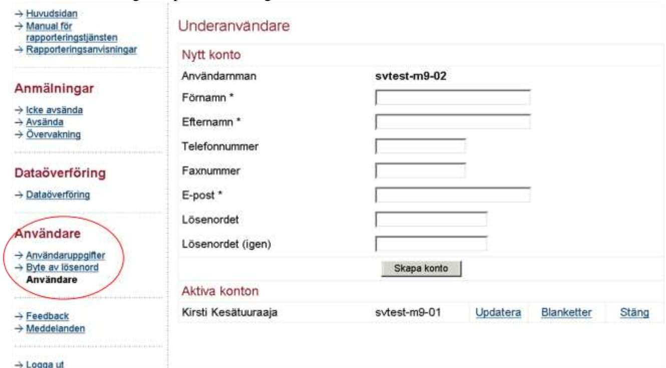
Bild 1. Hantering av underanvändarnamn under punkten "Användare".

Det användarnamn som företaget först anhöllit om blir administratöranvändarnamn. Om företagets administratör byts ut, ska personens kontaktinformation ändras i punkten "Användaruppgifter" (Bild 1). Administratören kan skapa nya underanvändarnamn till tjänsten i punkten "Användare". Under punkten "Uppdatera" på denna sida kan administratören skapa nya lösenord åt underanvändare och uppdatera deras uppgifter. För att avlägsna koder, gå till punkten "Stäng".